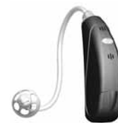
Quantum 12 M micro BTE

Le modèle Quantum 12 micro BTE convient aux pertes auditives légères à sévères et à des configurations d'audiogrammes allant de courbes inversées à des courbes à pente marquée.