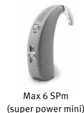
Max 6 SPm (super power mini)

Max 6 SPm convient aux pertes auditives sévères à profondes et s'adapte aux configurations d'audiogrammes allant d'une courbe inversée à une pente de ski.