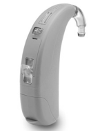
Max 6 SP (super power)

Max 6 SP convient aux pertes auditives sévères à profondes et s'adapte aux audiogrammes de configuration inverse jusqu'aux pentes abruptes.