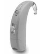
Max E SP (súper potente)

Max E SP es adecuado para pérdidas severas a profundas y para audiometrías de configuración inversa y caída brusca en agudos.