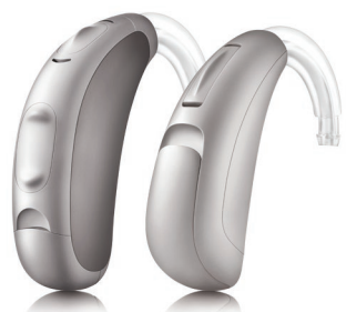
Contours d'oreille Stride

Stride™ ouvre la voie en matière de conception axée sur le patient. Cette nouvelle gamme de styles de contours d'oreille (BTE) et d'intra-auriculaires (ITE) impressionne par son esthétique et son confort d'appareillage, et séduit les patients par ses contrôles intuitifs qui offrent des choix adaptés à tous les besoins. Reposant sur la plateforme North, qui marque le début d'une nouvelle ère en matière de qualité sonore naturelle, Stride regorge de technologies pour véritablement permettre à vos patients de cibler les conversations dans tous leurs environnements d'écoute. Aider vos patients à trouver une solution adaptée n'a jamais été aussi simple grâce à Stride.