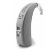
Max 20 SPm (super power mini)

Max 20 SPm convient aux pertes auditives sévères à profondes et s'adapte aux configurations d'audiogrammes allant d'une courbe inversée à une pente de ski.