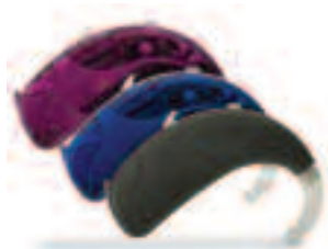
写真のサイズは実際のサイズではありません。